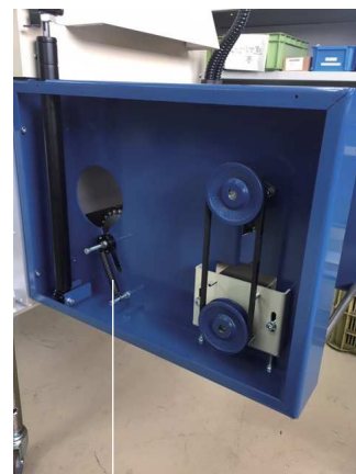
コンベアテンションスプリング